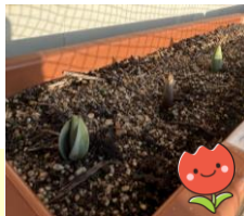
年長さんが植えたちゅうりっぷが大きくなってきました！嬉しさと同時に3月が近づくとさみしさも感じます。園生活を毎日楽しく過ごしてほしいです。

さて、今月は絵画展を開催し一年間の作品を展示いたします。子ども達は普段の保育や絵画教室の中で様々な素材に触れながら制作を楽しんでいます。「わぁ！すごい！」という心が動くような瞬間を感じながら作った作品は、どれも世界にひとつのだけの素敵な作品となっています。作品をみるとその力強さや繊細さ等を感じますが、それと同時に「どんな思いで描いたのかな。」と子ども達の思いを想像することも楽しみの一つでもあります。同じものを見てもみんな違う自分の感性で作った作品は夢がいっぱい詰まっているものばかりで大人もパワーをもらいます。保護者の皆様にはお子様と一緒にご観覧頂き、成長を感じて頂くと共に沢山褒めてあげて下さいね。今年度も多くの方に見て頂けるよう人数制限を設けておりませんので、送迎時も合わせてご都合のいい時間にご観覧頂けたらと思っております。沢山のご参加を宜しくお願いいたします。